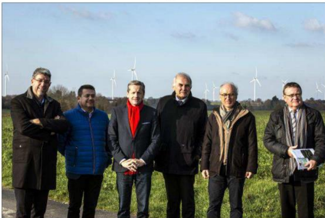
Les quatre départements de l'ex-Poitou-Charentes ont joué l'union sacrée contre l'invasion des éoliennes sur leurs territoires.